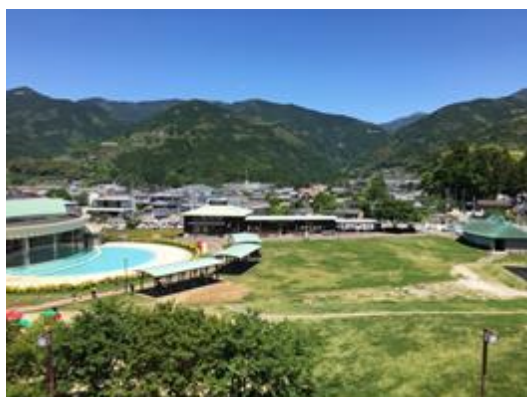
香北町周辺の様子